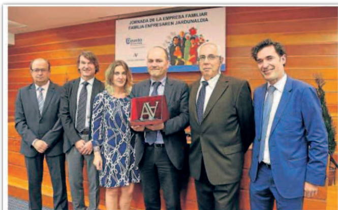
El Grupo Salva, premio al empresario familiar de 2016

Asimismo, el diario Expansión especial, en su edición de 25 de junio de 2016 recogió la labor que está llevando a cabo la Universidad de Deusto (además de la Universidad Esade, IE, IESE y UOC) en relación a la empresa familiar.