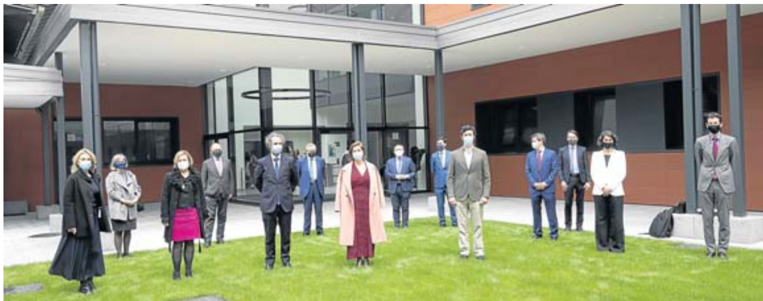
Asistentes a la entrega del premio Antonio Aranzábal en la Universidad de Deusto.