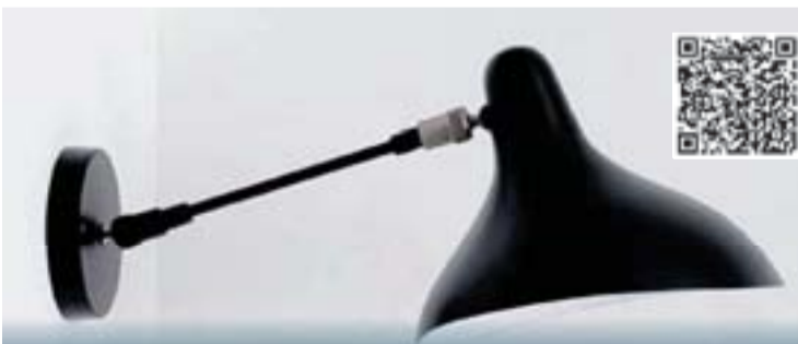
Mantis Aplique BS5

Schottlander creó la serie de lámparas "MANTIS". El cuerpo y base son de acero y la pantalla de aluminio. Talla: Ø22 cm. H: 20,5 cm. ANCHURA: 45 cm. Color: negro.