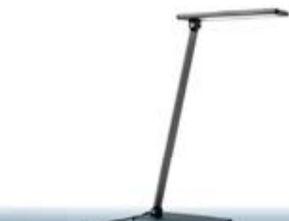
Flexo Touch de Sulion

Máxima eficiencia: 1.000 luxes a 40 cm. Tiene una potencia máxima de 8 w. Altura máxima de 56 cm. con una base muy delgada de 20 x11 cm.